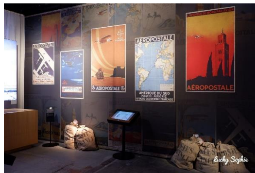
Pilote d'avion émérite

On suit le fil de sa vie, guidés par sa mère avec laquelle il entretenait une correspondance fournie. On y découvre ses succès en tant qu'aviateur, mais ses crash aussi, son travail pour l'aéropostale, sa fibre d'inventeur avec 12 brevets déposés, ses talents d'écrivain vite reconnus, ses missions de grand reporter.