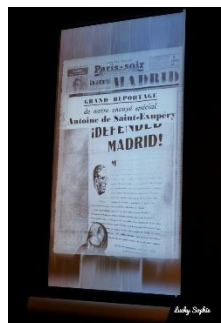
et grand reporter !

On découvre son engagement lors de la Seconde Guerre Mondiale en tant que pilote de reconnaissance, avec un acharnement à être utile qui lui a finalement coûté la vie.