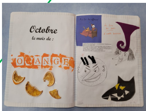
Une histoire à la bibliothèque