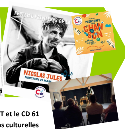
Partenariats avec la SNAT et le CD 61 pour la création d'actions culturelles