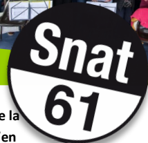
Intervention de la conseillère numérique de la SNAT 61 tous les lundis après-midis jusqu'en juin 2023