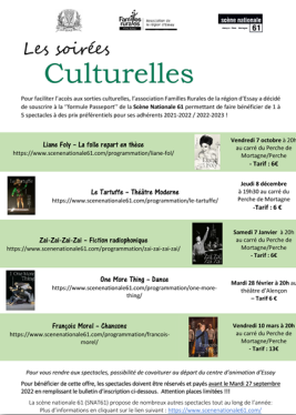
Création des "soirées culturelles" (tarifs réduits à sur 6 spectacles, organisation de covoiturage)