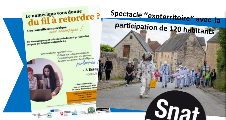
Intervention de la conseillère numérique de la SNAT 61 tous les lundis après-midis