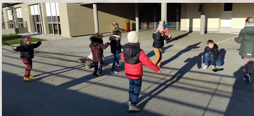
Bouger son corps au soleil pour faire le plein d'énergie !