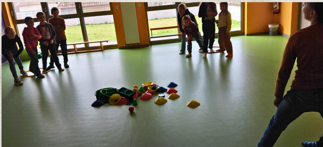
La chasse aux couleurs en salle de motricité !