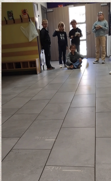
Lancer assis... Facile ou pas ?