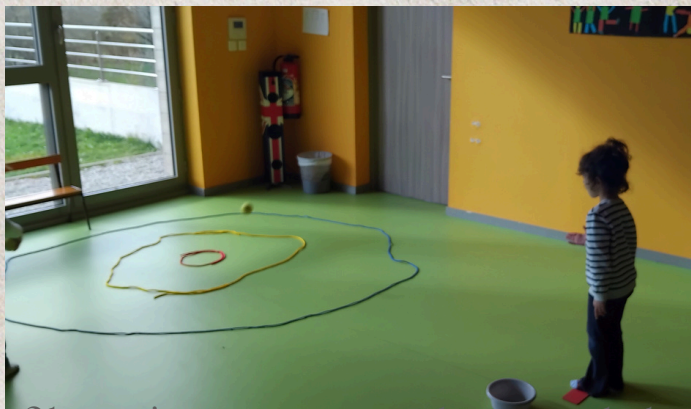
Olivia s'apprête à viser le coeur de la cible...