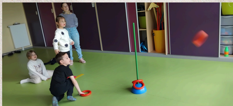
Et lancer l'anneau autour du bâton ?