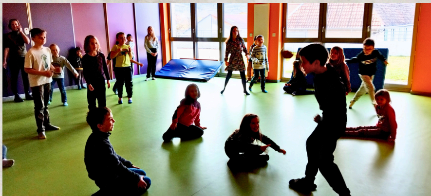
Une partie de balle autrichienne...