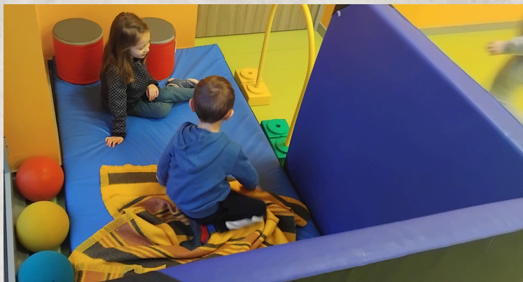
Une cabane d'enfants :)

Cet hiver, nous avons adapté nos programmes d'activités du midi, puisque les enfants se partageaient en deux groupes : les adeptes de la balle autrichienne et ceux qui préféraient le coloriage... Dès la rentrée, l'appel de l'extérieur devrait rétablir l'équilibre et les activités se diversifier !